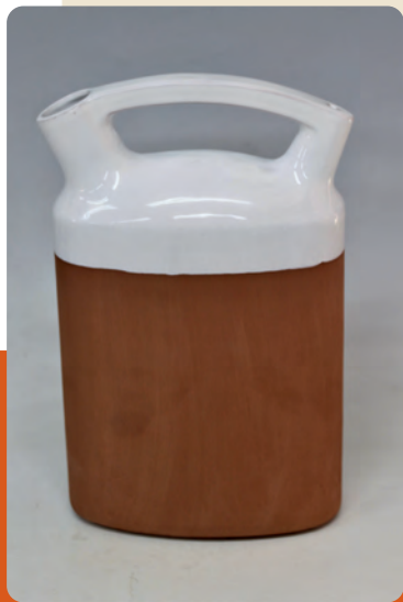
Càntir 2019 Disseny de Miguel Milá Edició numerada i limitada

→ A les 19 h, a la Plaça de la Església Inauguració oficial d'Argillà Argentina 2019 Fira Internacional de Ceràmica