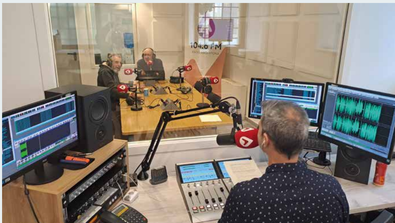
Els Notxas van ser dos dels convidats del programa especial del 13 de febrer (MT).

LA DADA: La celebració del dia Mundial de la Ràdio el 13 de febrer, va ser proclamada per l'Assemblea General de les Nacions Unides en la seva 36a reunió, d'acord amb la resolució aprovada per la Conferència General de l'Organització de les Nacions Unides per a l'Educació, la Ciència i la Cultura el desembre de 2011. Es va triar aquesta data, per ser el dia en què es va establir la Ràdio de les Nacions Unides el 1946