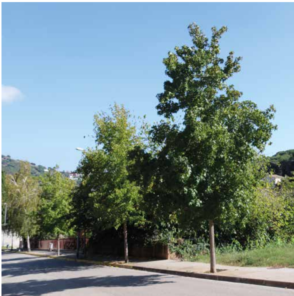
La parcel·la municipal A Can Serra Lladó on es projecte desenvolupar un projecte d'habitatge cooperatiu es troba darrere l'Escola Bressol El Bosquet (MRM).

Esquivar les regles del mercat especulatiu és el que persegueix el projecte del govern municipal, una alternativa a mitjà termini basada en el model cooperatiu en cessió d'ús. L'Ajuntament preveu impulsar aquest model a Can Serra de Lladó establint un conveni amb la cooperativa Sostre Cívic, construint una vintena d'habitatges accessibles i estables.