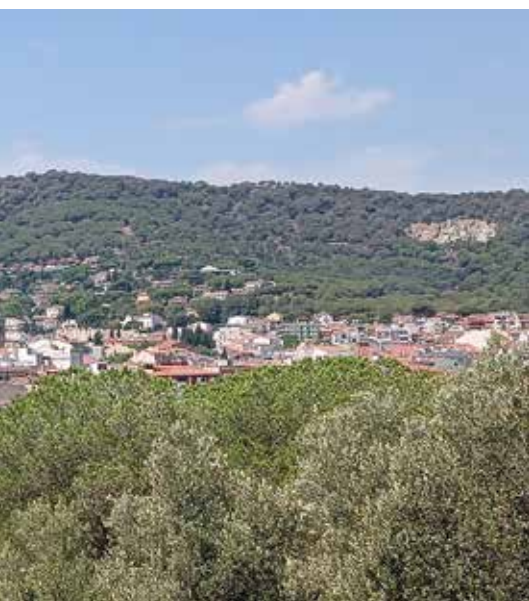
es han substituït els camps de conreu (MRM)

Però hi ha propietaris forestals disposats a gestionar els seus boscos. El problema és que el seu manteniment no els resulta rendible, cosa que en dificulta encara més la gestió. Al Baix Maresme, la predominança del pi pinyoner agreuja la situació, ja que té un valor comercial inferior al de les sureres de l'Alt Maresme, on la producció de suro permet una explotació més sostenible. Sense un incentiu econòmic clar, molts propietaris op-