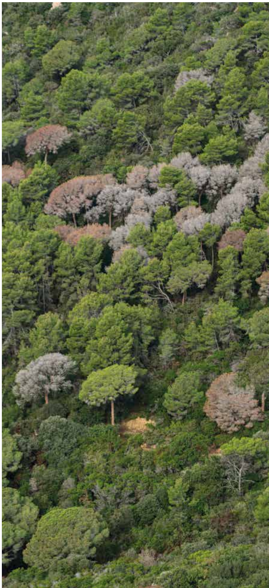
Pins morts al Turó de Cirés (MT)