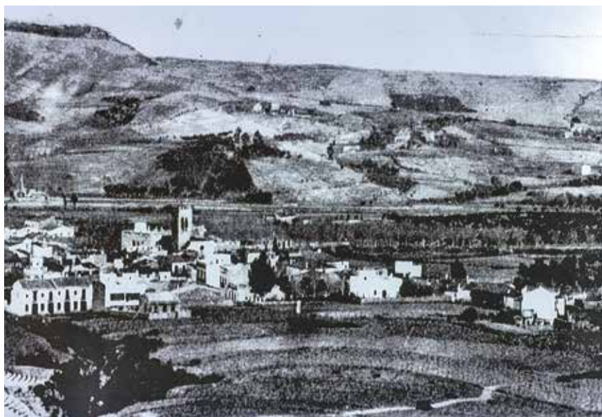
Postal d'Argentona del segle XIX d'autor anònim

Un dels principals obstacles per a una gestió forestal més efectiva és la distribució de la propietat. A Argentona, aquesta realitat és especialment significativa, ja que el 99,54% de la superfície forestal és de titularitat privada. Només dues petites finques pertanyen a l'Ajuntament: la Font Picant (8,4 ha) i el Rocar (3,16 ha), que en conjunt representen tan sols el 0,45% del total. En comparació, a Catalunya el 78% dels boscós són privats i el 22% públics, fet que evi-