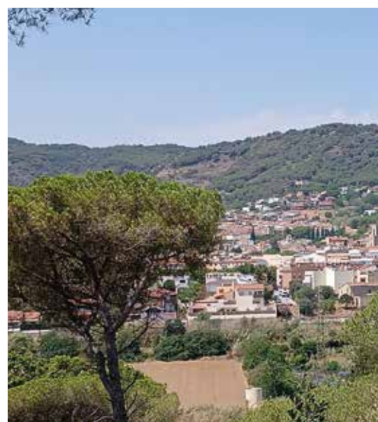
Panoràmica actual d'Argentona que mostra com els arb-