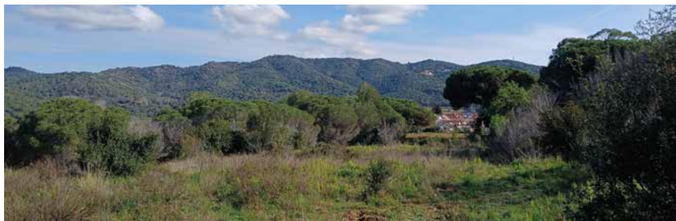
L'espai on s'ha de desenvolupar la urbanització del Cullell, al Turó de Sant Sebastià, actualment és un paratge de bosc mediterrani i també compta amb alguna zona de conreu (MRM).