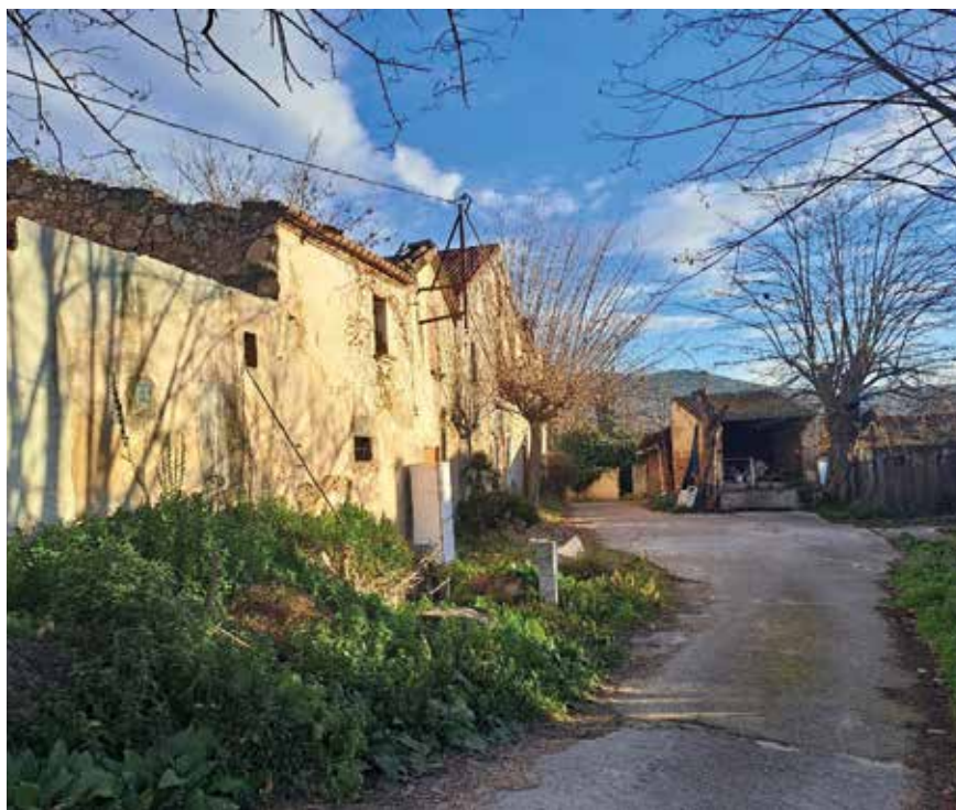
Actualment, Can Cirés es troba en estat de semi abandonament (MT).

La política municipal d'habitatge inclou diverses línies d'actuació. Una passa per fer obra, de construcció o reforma. Aquest és el cas de Can Cirés , format per la masia, la masoveria i diversos cossos auxiliars. Actualment, el conjunt encara és privat, però quan es cedeixi al Consistori la part que li correspon, aquest ja ha previst què en farà. Per una banda, rehabilitarà la masia per convertir-la en equipament municipal i, per l'altra, habilitarà tres o quatre habitatges públics de lloguer.