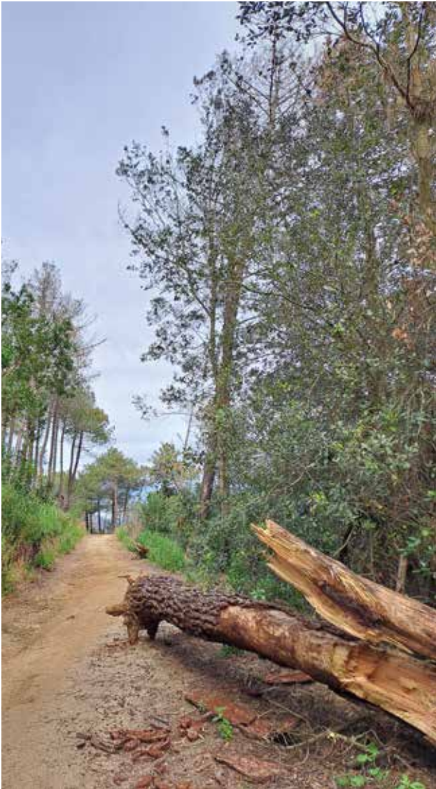
Arbres tal·lats en un camí del veïnat de Clarà (MT)

Per facilitar la gestió dels terrenys forestals, els propietaris poden acollir-se als plans de gestió del Centre de la Propietat Forestal de la Generalitat, que cobreixen fins al 80% del cost. A Argentona, onze finques que