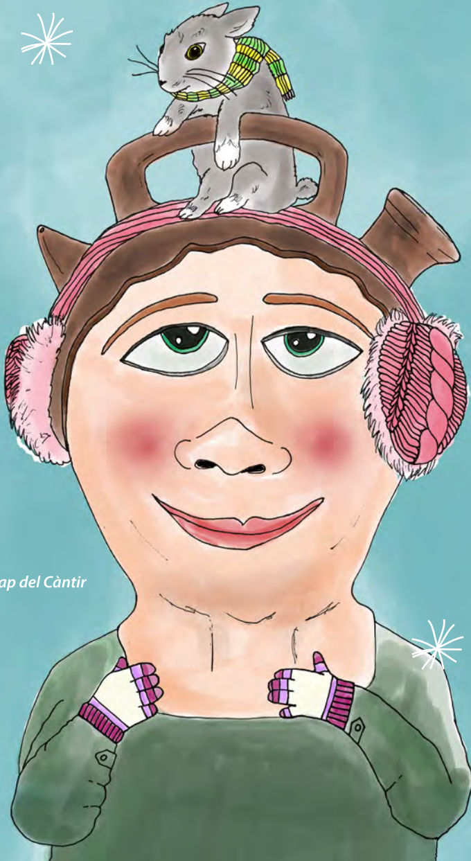
El Cap del Càntir