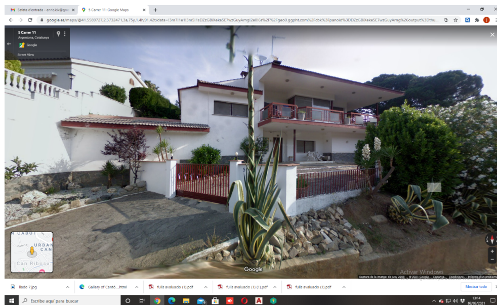
Foto de l'habitatge objecte de la present llicència

A l'informe tècnic emès en data 05/02/2021 on posa Carrer 11 5A, ha de dir Parcel·la 5 A de la urbanització Can Raimí, atès que el nomenclàtor de carrers que apareix a google maps i al registre electrònic del cadastre no ha estat aprovat per la Corporació.