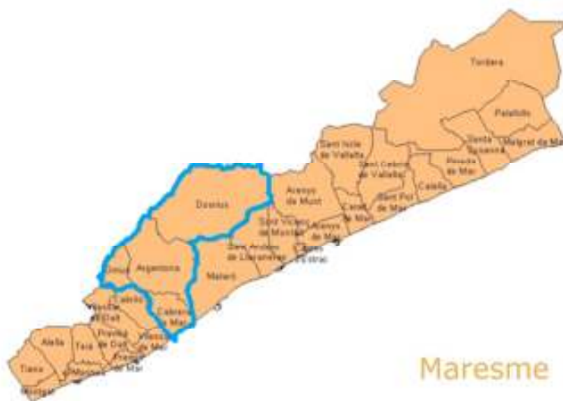
Figura 1: Els quatre municipis de la Riera d'Argentona dins la comarca del Maresme

El Maresme està integrat per un total de 30 municipis. És la quarta comarca més poblada de Catalunya (456.565 hab.), amb municipis que oscil·len entre els 700 habitants d'Òrrius i els 124.000 de Mataró que n'és la capital.