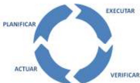
Figura 16: Plan Do Check Act

Es recomana realitzar una sessió de Deming trimestral (4 x any) i una sessió global de major profunditat a finals d'any. En aquestes sessions, preparades a consciència i treballades també un cop realitzades, s'explica, avalua i es proposen canvis sobre cada acció o àmbit d'activitat. Idealment, tots el personal d'una organització hauria de ser responsable últim d'algunes accions, i per tant formaria part de les sessions com a protagonista.