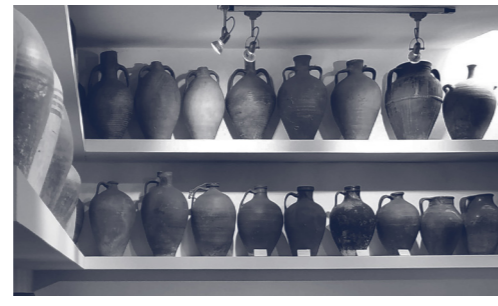
HO ORGANITZA: MUSEU DEL CÀNTIR D'ARGENTONA

CONFERÈNCIA I INAUGURACIÓ DE L'EXPOSICIÓ "FOTOGRAFIES DE NATURA", DE SEBASTIÀ RIERA