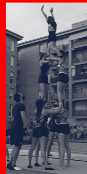
HO ORGANITZA: CLUB ESPORTIU CRAZY JUMPERS

Actuació de gimnàstica esportiva del grup de mitjans i del grup de grans. Una exhibició de salts, acrobàcies, equilibris i figures que, sense dubte, ens tornaran a deixar bocabadats.