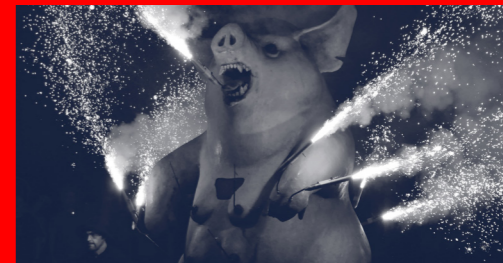
HO ORGANITZA: DIABLES D'ARGENTONA

La Trobada de Bestiari, convida al Moskamot de Santa Eulàlia (Barcelona) i l'Atzeries de La Vella de Gràcia que, juntament amb La Polseguera, es planten a la plaça de Vendre perquè petits i grans les puguin contemplar i aprendre'n la història. Durant l'estona de la plantada hi haurà activitats per a la quitxalla, amb la col·laboració de l'Agrupament Escolta Calabrot d'Argent.