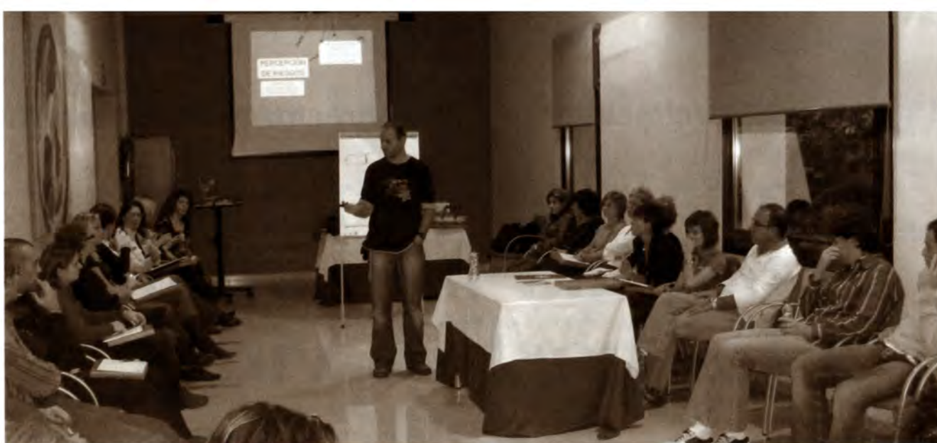
Un moment de la xerrada que va oferir el tècnic d'Energy Control.