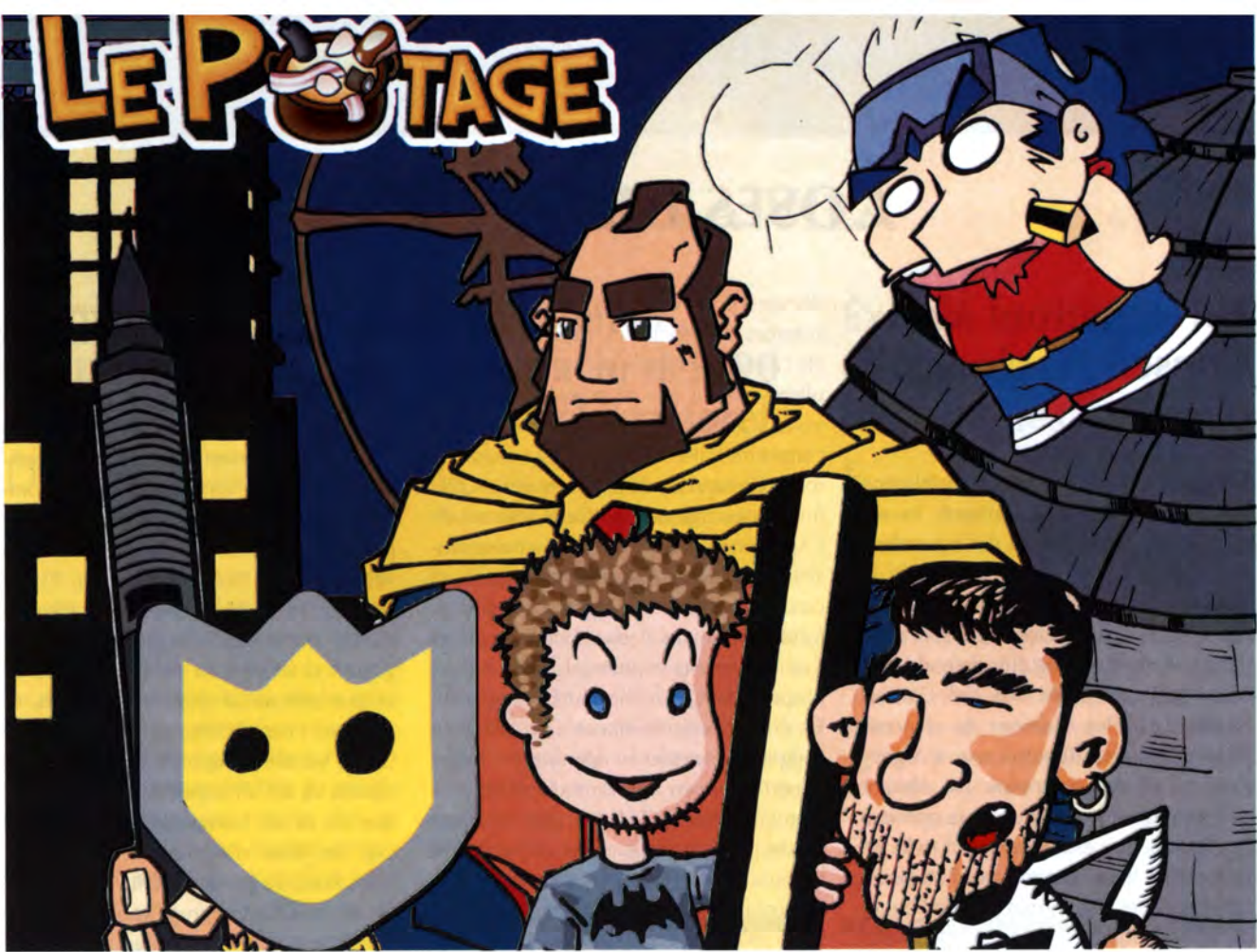
Autoretrat de l'equip de dibuixants de Le Potage .