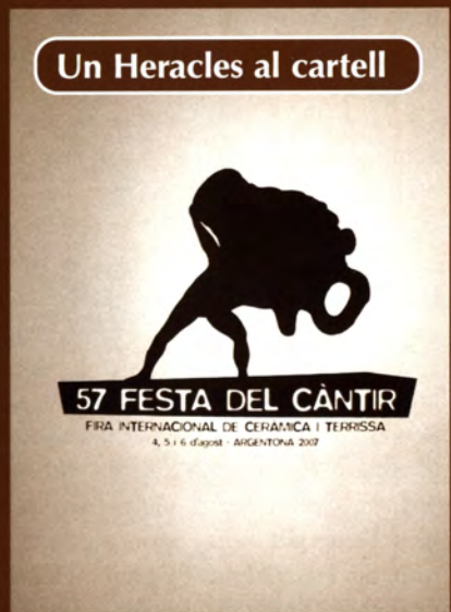
Un Heracles al cartell