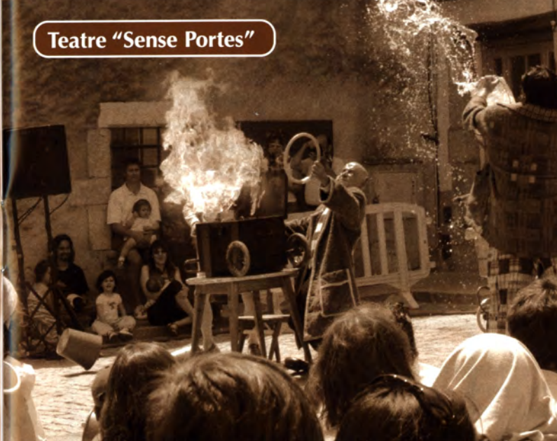
Teatre "Sense Portes"