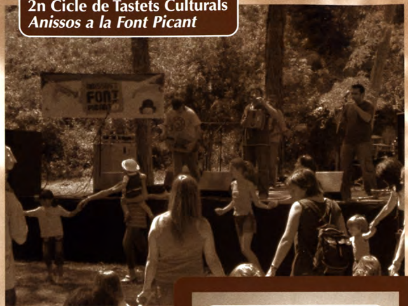
2n Cicle de Tastets Culturals Anissos a la Font Picant