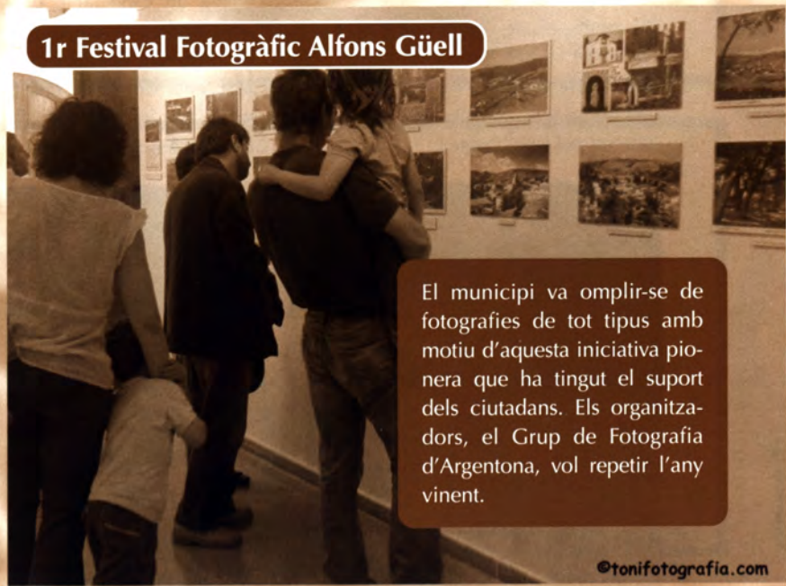
El municipi va omplir-se de fotografies de tot tipus amb motiu d'aquesta iniciativa pionera que ha tingut el suport dels ciutadans. Els organitzadors, el Grup de Fotografia d'Argentona, vol repetir l'any vinent.