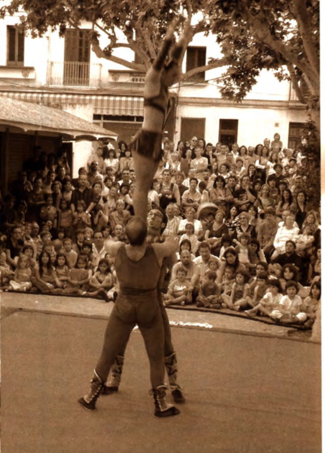
Unes 3.500 persones van assistir al primer Festival Internacional de Teatre al Carrer "Sense Portes", que es va celebrar el 12 i 13 de maig. Companyies internacionals amb diferents espectacles van oferir un viatge màgic a l'espectador, que trobava sorpreses interpretatives en l'espai que va de la plaça de Vendre a la plaça de l'Església.