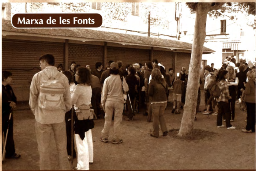
Marxa de les Fonts