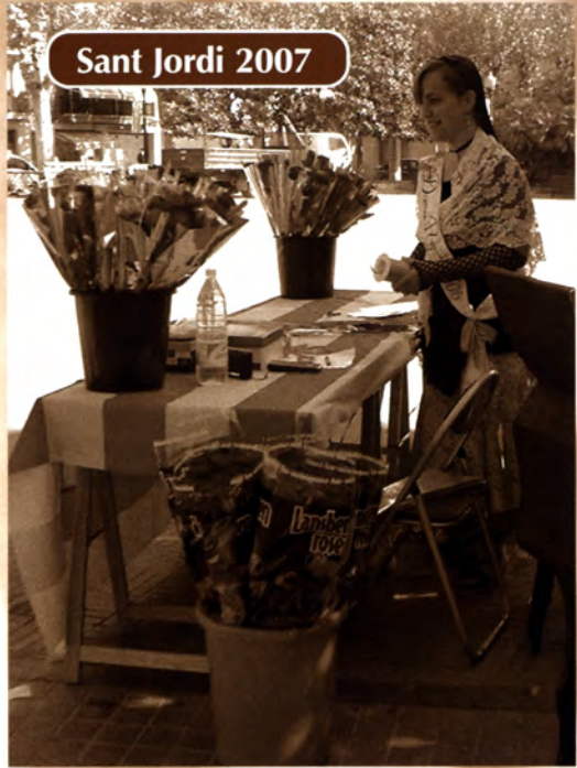
Sant Jordi 2007