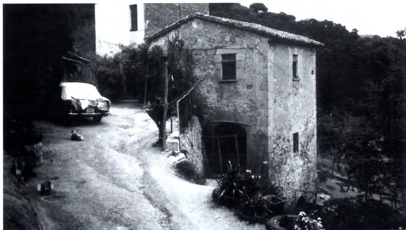
En la imatge superior, un detall de la masia i en la imatge principal, el molí.