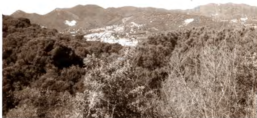
Les vistes que es poden veure des de Can Vilardell.