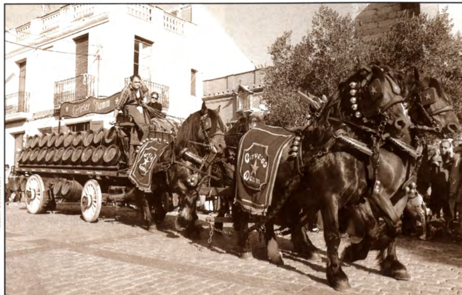
Els Tres Tombs, 125 anys: El retorn a l'itinerari tradicional, amb l'inici al final del carrer Bellavista, i la participació del carruatge de la casa Damm van ser les principals novetats de la passada dels Tres Tombs en l'edició del 125è aniversari. Van participar-hi 150 cavalls i 30 carruatges.