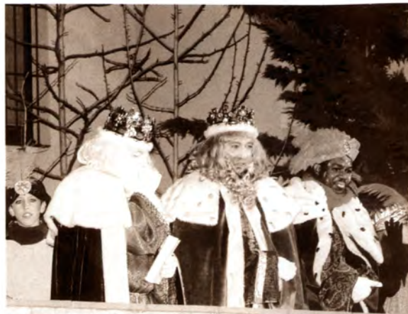
Cavalcada integradora: La Cavalcada 2005 va apostar per la diversitat i la integració social. El discurs del rei Baltasar va ser en mandinga, la seva llengua, mentre que el rei Gaspar es va dirigir al nombrós públic en castellà i el rei Melcior en català.