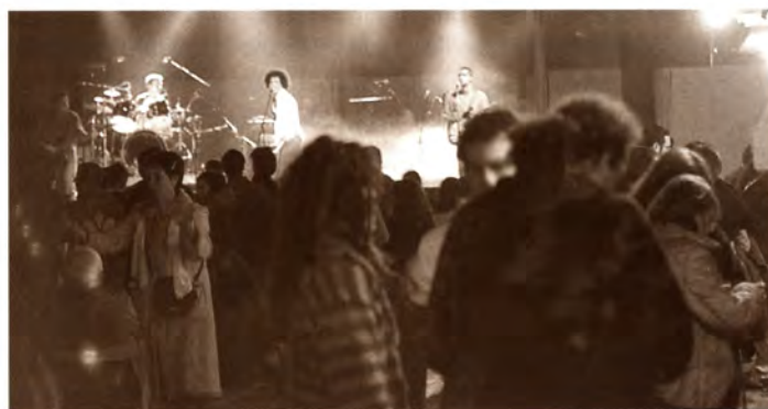
Argentona solidària: Els joves argentonins van recaptar 2.000 euros en la 5a edició de les 12 Hores Contra el Racisme i la Xenofòbia. D'aquests, 1.000 es destinaran als afectats pel Tsunami i 1.000 a l'ONG Carantava amb projectes a Guinea Bissau. La tarda infantil, la nit jove amb els concerts, les paradetes, les activitats i les exposicions, tot i la davallada de públic, van ser els actes més destacats.