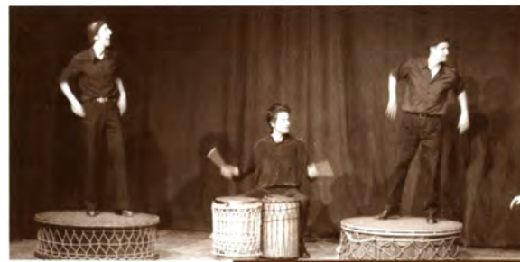
Percussió gran per a petits. L'espectacle Big Drums va aportar ritme a la darrera tarda de Festa Major amb altres espectacles dirigits al públic familiar.