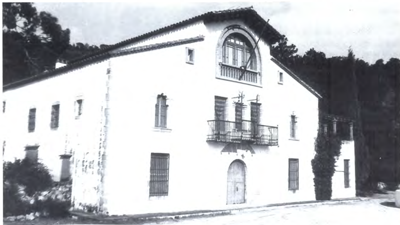
La façana principal de Can Marc amb el balcó al bell mig de la construcció.