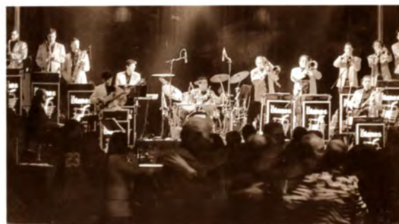
Música i espectacle: L'orquestra Blanes va ser l'encarregada d'amenitzar la ballada de sardanes, el concert i el ball de Festa Major de Sant Julià 2005. La cercavila de gegants, una tarda amb els Diables i la segona trobada de Ceptrots van ser altres actes de la Festa, que va finalitzar amb el concert a càrrec del Cor Madrigalista de Mataró.