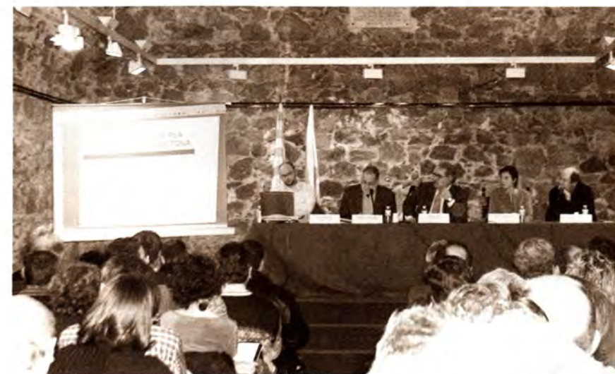
Jornada de presentació del Pla Estratègic.