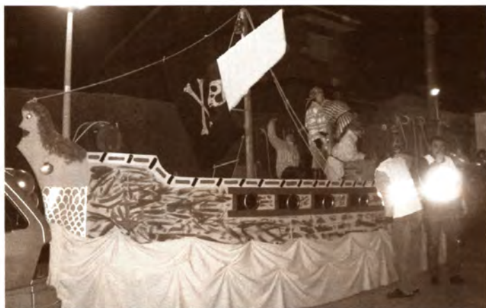
Vaixell de Pirates: La Colla de Geganters d'Argentona va endur-se el primer premi del concurs de carrosses de la Cavalcada de Reis 2005 amb un vaixell pirata. El segon premi va ser per al grup de country del Centre Parroquial i el tercer guardó per al Futbol Club Argentona.