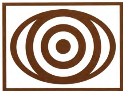
grup de fotografia centre d'estudis argentonins jaume clavell

El taller va superar totes les previsions. L'allau d'inscripcions, tant d'Argentona com de la comarca, va fer ampliar el nombre de places i l'organització ja pensa en una segona edició. La nova secció fotogràfica es troba els dimecres a les nou del vespre a la Casa Gòtica.