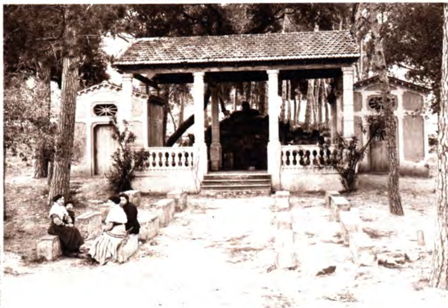
La font Ballot

Sens dubte que seria un acte molt emotiu poder fer la inauguració i que aquestes senyores fessin l'honor de presidir-la i honorar també la seva memòria des d'Argentona.