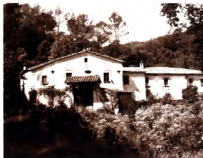
La masia de can Riudemeia.