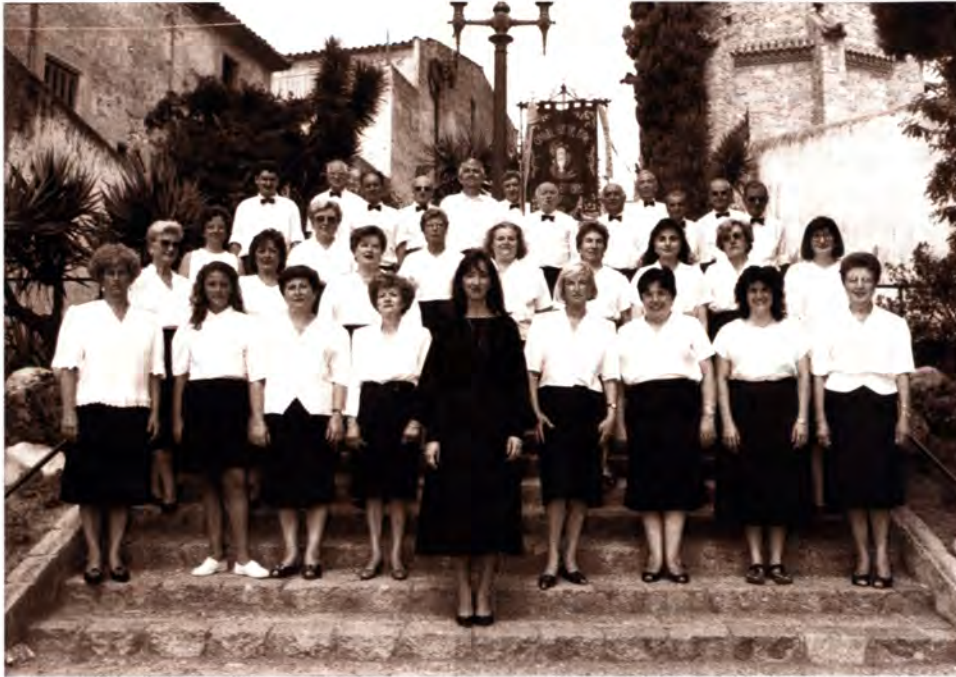
La coral fotografiada fa uns anys a les escales del costat de l'església.