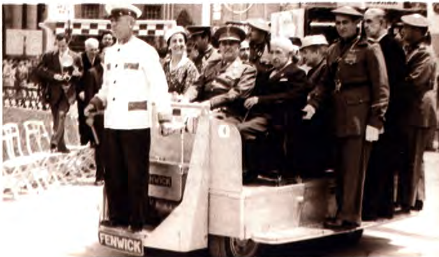
Franco a Barcelona, a la fira de mostres de juny del 57.

Les cartes dels lectors es poden lliurar a Ràdio Argentona fins al 2 de juliol del 2001 i han de tenir una extensió màxima de 1.600 caràcters. La redacció es veu amb el dret de no publicar-les, en cas que l'extensió sigui superior. L'escrit també es pot enviar a través d'e-mail a l'adreça: ra@argentona.com