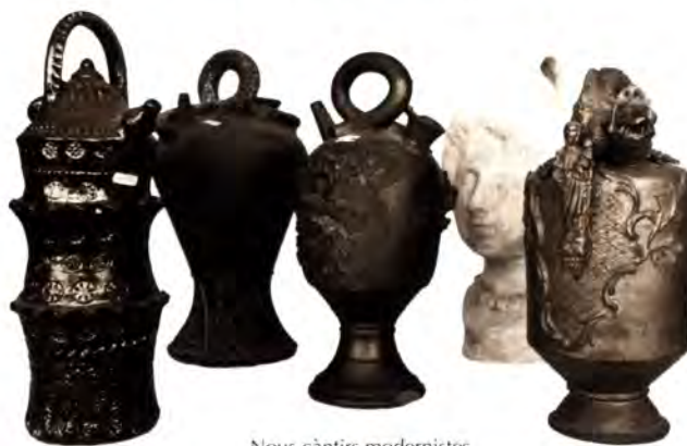
Nous càntirs modernistes.

El Patronat del Museu del Càntir d'Argentona, reunit en sessió informativa el dia 22 de març, va desestimar la idea inicial d'inaugurar el nou museu per la propera Festa Major. Aquesta decisió ve motivada, segons fonts del mateix museu, per les complicacions aparegudes en la redacció del projecte i adaptació de la Casa de Cultura com a museu, així com el retard en el trasllat d'algunes dependències municipals actualment establertes a l'edifici. L'equipament romanirà tancat un any més per les festes de Sant Domingo, des que el juny del 97 es va detectar l'aluminosi a Can Rectoret. Segons els responsables del museu, és millor endarrerir la data d'inauguració abans que fer un museu amb presses i excessiva pressió per una data propera, fet pel qual consideren l'endarreriment com un mal menor. En aquests moments s'està acabant de redactar el projecte museogràfic, que s'espera estigui enllestit en breu i sigui aprovat per l'Ajuntament en el ple del mes de maig. A partir de l'aprovació definitiva del projecte, l'empresa adjudicatària, Calidoscopi, tindrà un termini de sis mesos per enllestir les obres i s'espera inaugurar l'equipament dins el present any.