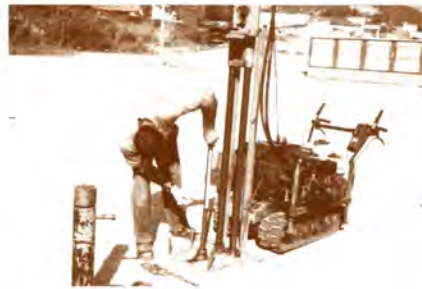
Estudi geotècnic del terreny.

Dos en un. La proposta arquitectònica que es planteja a la zona esportiva d'Argentona segueix la filosofia de noves construccions d'aquest tipus que s'han fet a altres poblacions catalanes com és el cas de Premià de Mar. És a dir, es reforma el pavelló existent, se'n construeix un de