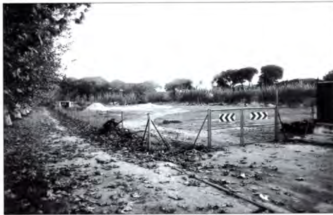
Els terrenys estan a punt de ser cedits a la Generalitat.