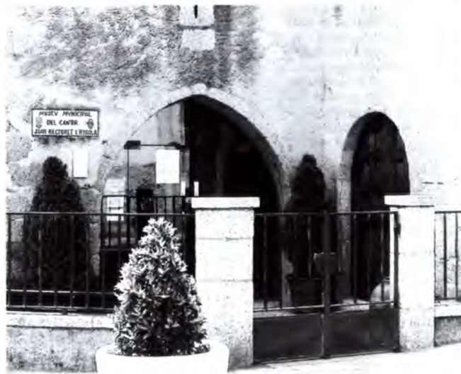
El museu no obrirà les portes aquest estiu.

Els responsables del museu han traslladat les 500 peces que estaven exposades al públic a la planta de dalt, a l'espera d'esdeveniments. Les 1.500 peces restants, que componen el fons del museu, estan en un magatzem que està al límit de la seva capacitat. És per això que les 500 peces han anat a parar a la planta superior ja que no hi ha cap més lloc per emmagatzemar-les. Oriol Calvo ha assegurat que no s'instal·la-