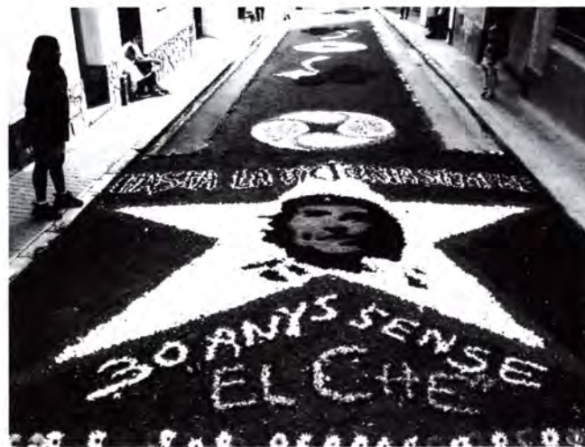
Al carrer Sant Julià van retre homenatge al Ché.