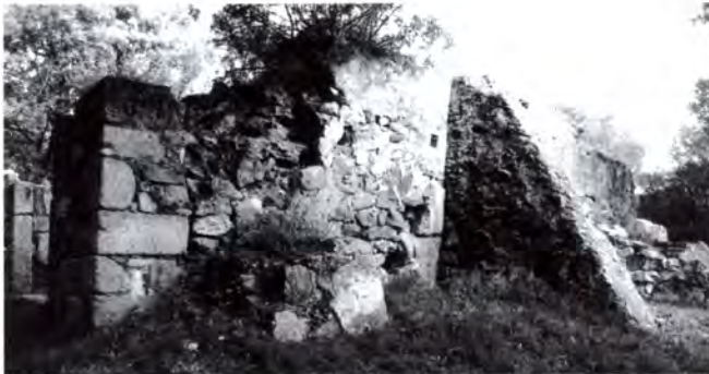
L'ermita de Sant Jaume de Traià, un dels monuments històrics de la zona.