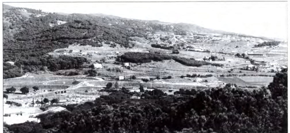
Vista general de Sant Jaume de Traià.

Tot plegat ha estat un llarg procés de deu anys de recursos i contrarecursos que ha tancat la sentència del Tribunal Superior de Justícia. El TSJC ha basat la seva decisió després de considerar que l'Ajuntament va actuar legítimament i correctament qualificant els terrenys com a zona agrícola. Un segon criteri que ha valorat el Tribunal ha estat el fet que la conselleria envaís les competències