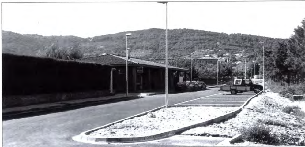
La piscina, lloc on dinen la majoria dels alumnes, era l'equipament que quedava més a prop de l'Institut.

L'aliment, el material i els monitors que vigilen el menja-