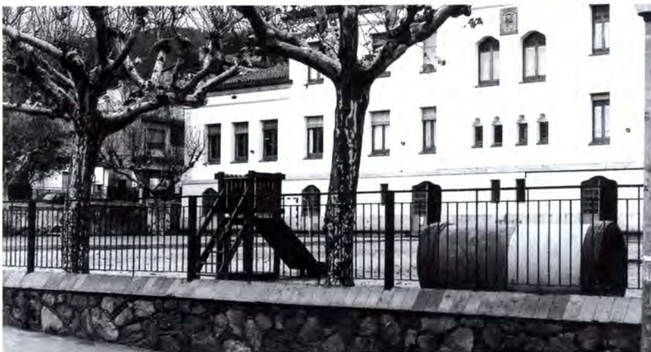
L'escola Bernat de Riudemeia serà un dels edificis que es modificaran per adaptar-se a les necessitats de les persones discapacitades.

A banda de l'aprovació d'aquest document, la supressió de barreres ja ha començat a la vila. Així, recentment s'han eliminat les barreres que hi havia a la plaça Nova. Les obres de rehabilitació de l'edifici noble de l'Ajuntament també es van fer pensant en l'accessibilitat dels minusvàlids. Pròximament s'iniciaran les obres de millora de la plaça del Canigó on, a més d'instal·lar-hi bancs, papereres i plantar-hi arbres, es construirà un accés per als minusvàlids.