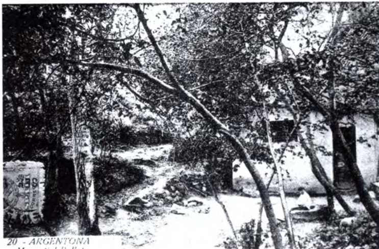
20 - ARGENTONA Manantial Follet

Aquesta Font, envoltada, encara avui, per una vegetació exuberant i acompanyada pels ocells que amb els seus cants fan més màgic aquest paratge, és constantment visitada per vilatans i forasters que vénen a provar l'aigua i a fruit de l'indret, tot recordant la seva dilatada història.