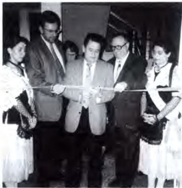
Inauguració de l'exposició del Casal dels Avis.

Cada cop hi ha més persones que volen conèixer el món de les manualitats artístiques amb roba. Això és el que es va comprovar en dues mostres que van organitzar paral·lelament el Casal d'Avis i els Amics dels Balls Tradicionals, el passat mes de novembre. D'una banda, l'entitat més