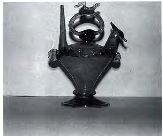
Càntir de vidre. Original del segle XVIII, museu del Castell de Peralada (Girona).

Tot i això dins la festa major d'hivern es posaran a la venda uns tiquets de 7.000 ptes. a compte, per tal de fer la comanda del càntir.