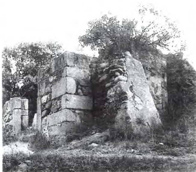
Restes de l'ermita que hi ha a la zona de Sant Jaume de Traià.