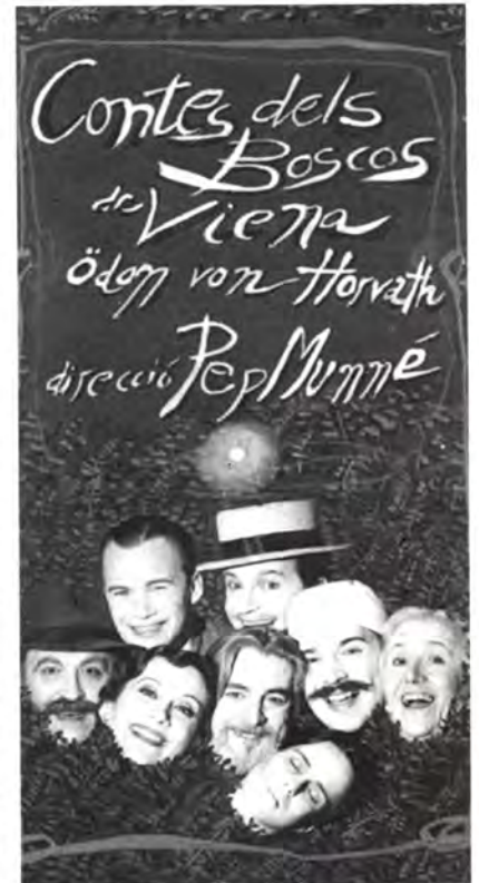
Cartell de presentació de l'obra.

L'obra es va estrenar el 9 de novembre al Teatre Condal de Barcelona.