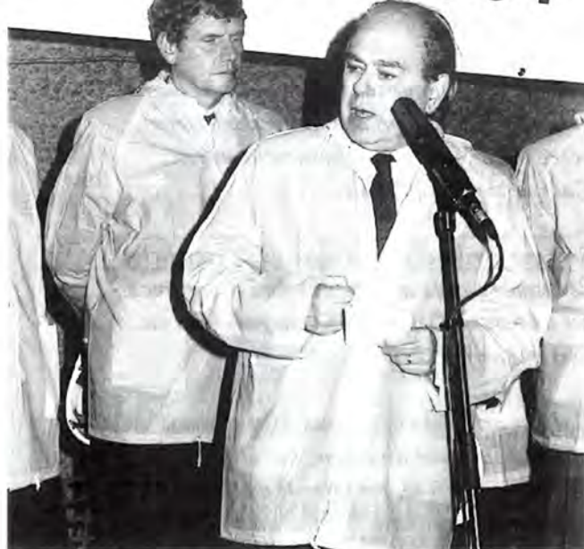
Jordi Pujol el dia de la calada del túnel de l'autopista Argentona - La Roca.

realitzat per la Generalitat de Catalunya, inclòs dins del Pla de Carreteres del 1988. L'autovia forma part del quart cinturó que enllaçarà la comarca del Maresme amb l'autopista A-2, de Martorell, passant per Terrassa. Aquest projecte va ser criticat per un sector de la població del Vallès Oriental. Precisament, durant la visita oficial, tres persones es van penjar per una de les boques del túnel per tal de col·locar una pancarta de protesta contra el quart cinturó.