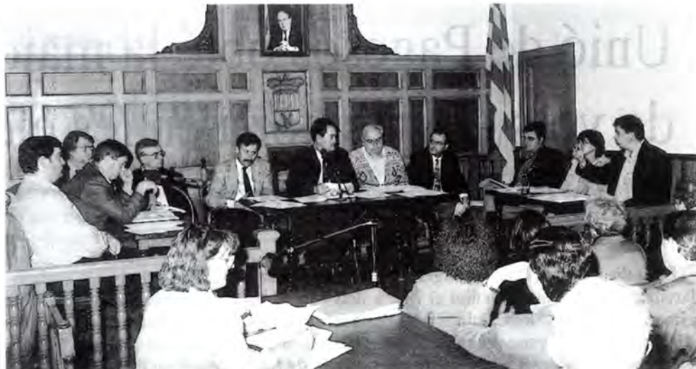
Ple del passat 11 de novembre. Ple polèmic.