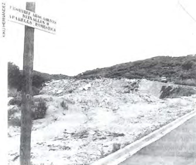
El darrer abocador incontrolat que s'ha eliminat.

Pel que fa a Catalunya la Conselleria de Medi Ambient de la Generalitat ha netejat més de 5.000 abocadors incontrolats en els darrers quatre anys. Entre aquests abocadors il·legals, més de 200 són de la comarca del Maresme i altres 200 més de la comarca del Baix Llobregat. D'aquesta manera, aquestes dues comarques de Catalunya són on Medi Ambient ha sanejat més abocadors.