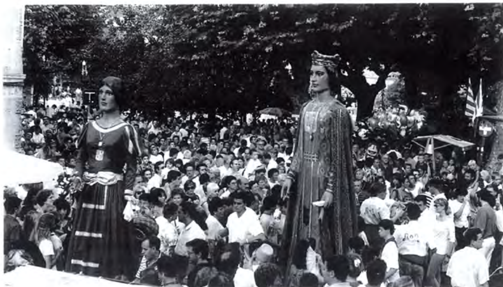
Els gegants, com és habitual, van ser presents a la festa.

Ja a les 10 del vespre va començar la tradicional nit boja amb la batucada a la plaça de l'Església. Acte seguit, el tradicional correfoc amb els diables d'Argentona, juntament amb la participació de la Ventafocs de Barberà del Vallès i el drac de Granollers. Un cop acabat el correfoc la festa va continuar a la plaça Nova amb ball, a càrrec