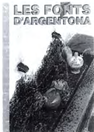
Coberta de la reedició del llibre Les fonts d'Argentona.