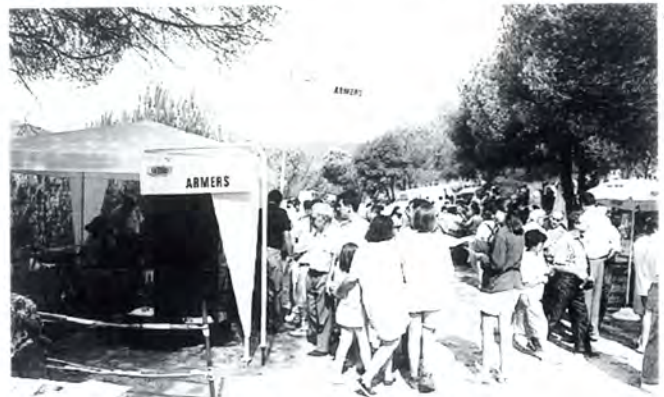
Un dels estands de la Fira del Caçador.

Unes 10.000 persones van assistir a la Fira del Caçador que es va celebrar, el passat diumenge 4 de setembre, al paratge de Can Comalada. Segons l'organització, el nivell d'assistència va ser l'esperat i molt semblant al d'edicions anteriors.