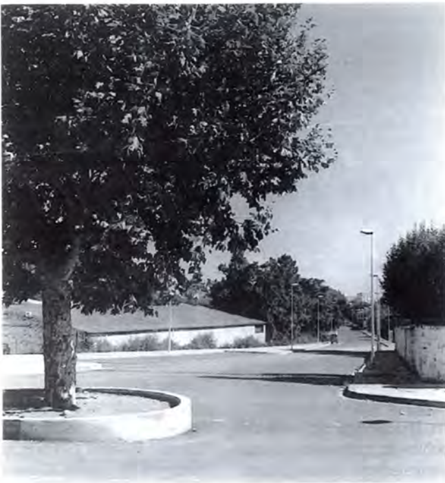
El nou aspecte de l'avinguda dels Països Catalans.

El passat dijous 14 de juliol, van finalitzar les obres d'asfaltatge de l'Avinguda dels Països Catalans. Les obres, que milloraran els accessos a la zona esportiva de la vila, van patir un retard motivat pel canvi d'empresa encarregada de les obres. Els treballs consistien, bàsicament, a aplicar una primera capa d'asfalt al llarg de l'Avinguda dels Països Catalans.