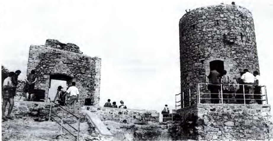
Vista del castell amb l'aspecte que ofereix després de la consolidació.

El passat dijous 21 de juliol es va inaugurar el castell de Burriac, després de les obres d'arranjament que han durat gairebé un any i han tingut un pressupost d'uns 30 milions de pessetes.