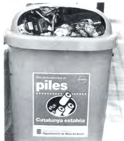
Aquest contenidor és de piles.