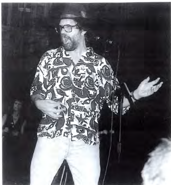
Tomeu Penya en un moment de la seva actuació a Argentona.