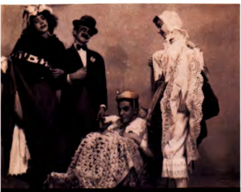
Cultura * Pàg. 9

Argentona viurà set dies de festa amb un programa que inclou activitats per a tothom * Pàg. 12