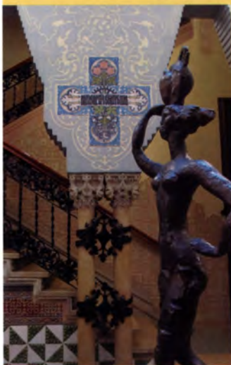
Casa Coll i Regàs, Mataró