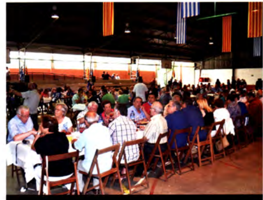
Esports * Pàg. 16

Mercè Zazurca, l'arquitecta que rehabilitarà la casa Puig i Cadafalch