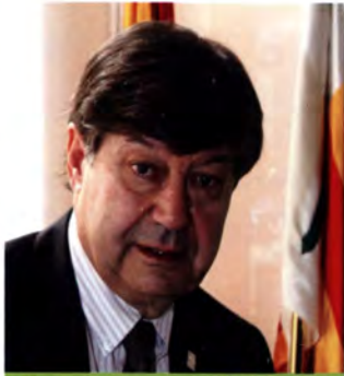
Ferran Armengol Alcalde d'Argentona