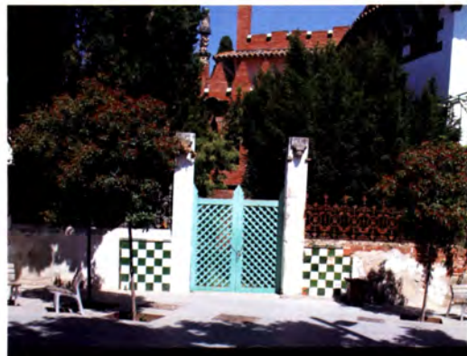
Societat * Pàg. 10

Se celebra la 3 o Setmana de la Memòria Històrica