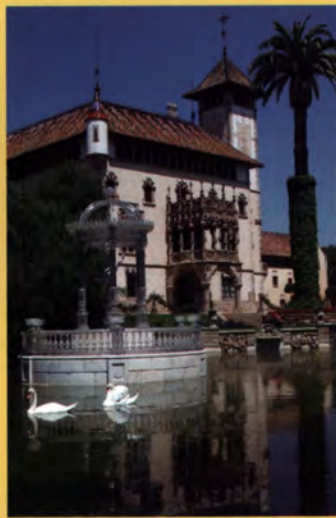
Casa Garí, Argentona

Mataró: Saló de sessions de l'Ajuntament, Casa Natal de Puig i Cadafalch, El Rengle, Botiga La Confianza, Casa Parera, La Beneficència i Casa Coll i Regàs.