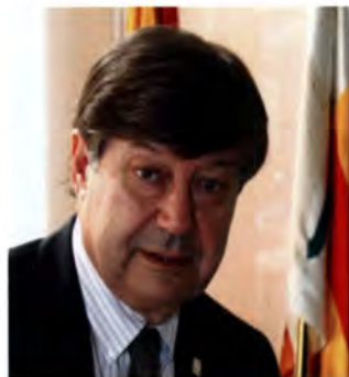
Ferran Armengol Alcalde d'Argentona