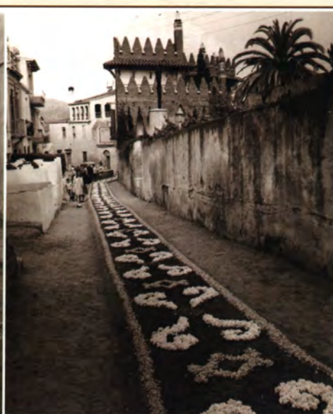
Foto esquerra: carrer Torras i Bages Any: 1955