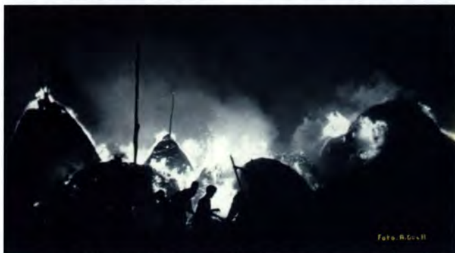
Instantània de l'incendi dels pallers de can Camps i text manuscrit del mateix fotògraf. Aquesta quadre ha estat més de 50 anys penjat al seu despatx.