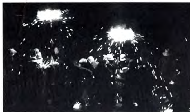
Un moment del correfoc.

de la festa. D'altra banda el to general de la festa d'aquest any ha sigut la participació del públic en els actes al carrer i també en els balls de la Sala.