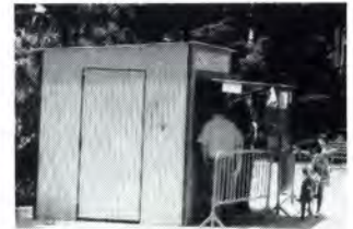
La caseta de la Plaça Nova.

De cara a les pròximes festes de Sant Joan i Sant Pere, les casetes de venda de productes pirotècnics s'hauran d'instal·lar en llocs d'Argentona que no suposin un perill imminent per zones habitades. Les dues casetes de venda de material pirotècnic s'hauran d'instal·lar a la Ronda Exterior, al cantó de Sant Sebastià i al carrer Bellavista, tocant a la carretera de Vilassar.