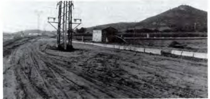
Aquesta zona nord és un dels sectors de la zona industrial del marge dret de la Riera.

riera. D'aquí a poc temps començarà la urbanització de la zona industrial del Cros, a les que s'hauran d'afegir les naus que s'han de construir dins del pla de reforma interior del