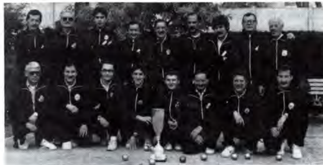
El C.P. Argentona al complet.