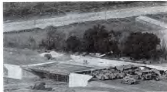
Estat de les obres de l'enllaç de la variant de la N-II amb l'autopista Argenton-La Roca.

La Generalitat calcula que per aquesta autopista lliure de peatge hi circularan uns 10.000 vehicles cada dia.