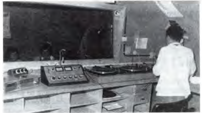
Els antics estudis havien quedat obsolets.

Les altres hores d'emissió queden intactes fins les 10 de la nit que es donarà pas a una connexió amb una emissora de caràcter públic.