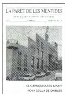
La publicació satírica.

Aquesta publicació tenia el format de mig foli, quatre planes en blanc i negre. A més d'informar dels actes de Carnestoltes hi havia quatre escrits titulats "Argentona m'esborrona", "El viatge d'en Garb", "El col·lectiu Triquinosi prepara el Carnestoltes" i "Llucifer ja és a Argentona".