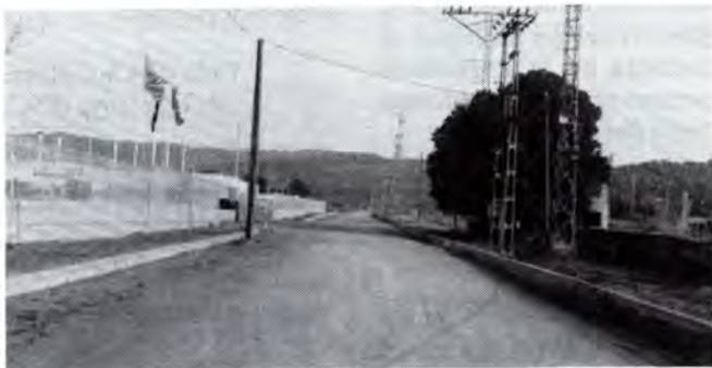
El total de carrers urbanitzats té una llargada de 2 Km.