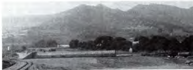
Estat de les obres de la variant, al fons Burriac i a l'esquerra el nucli de Madà.

El cost total de l'obra és de 66.000 milions de pessetes per 44 quilòmetres de recorregut. Pel que fa a la variant de Mataró i que afecta al terme d'Argentona, el recorregut és de 8 quilòmetres. Aquest tram que arrenca de l'actual bifurcació de l'autopista A-19, serà lliure de peatge, està projectada per poder-hi circular a uns 100 quilòmetres per hora i tindrà tres carrils d'una