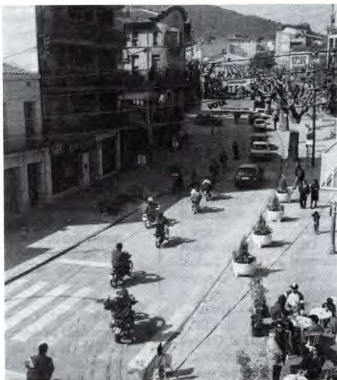
Un moment de la manifestació del dia 7 de març.

Ja en el primer ple després de la tornada de Jordi Suari