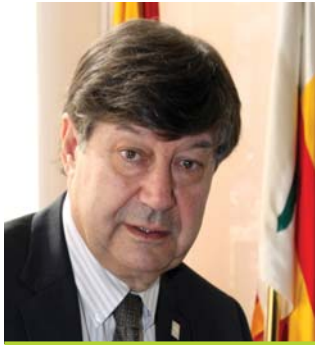
Ferran Armengol Alcalde d'Argentona