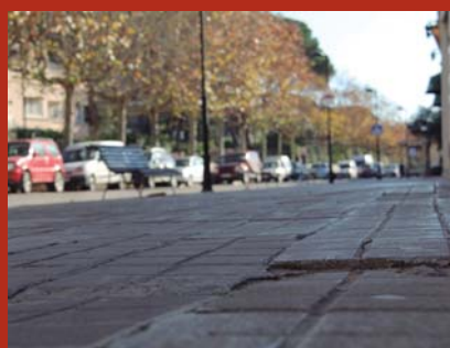
Arranjament i restauració de voreres i carrers 120 mil euros