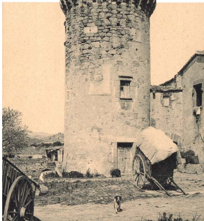
Can Mallol de la Torre, actualment can Palauet, que fins a mitjans del segle XIX estava en el terme d'Argentona. Postal ATV, 1908, Col. MASMM.

Alguns exemples de la parròquia de Sant Feliu de Cabrera: