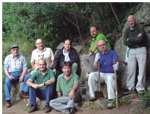
El Grup de Fonts avui i el 1982 a la Font de la Pastanaga. (Cedides per Pep Padrós i Jordi Torres)

La trajectòria del Grup de Fonts d'Argentona també ha rebut el primer reconeixement, en l'àmbit local, per part de Natura. Aquesta entitat que va néixer l'any 1977 i continua ben activa. Cada diumenge al matí una bona colla de socis es troben per mantenir en bones condicions una desena de déus de la vila.