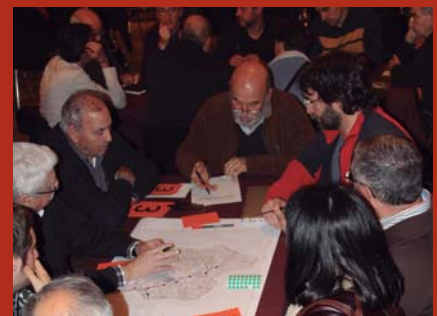
Redacció del nou Pla General d'Ordenació Urbanística 76 mil euros