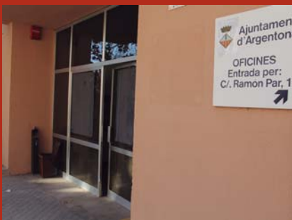
Obres de la nova Oficina d'Atenció al Ciutadà (OAC) 150 mil euros