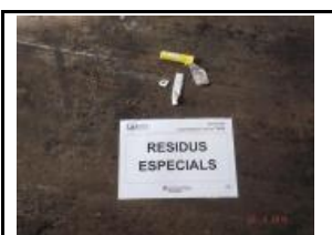
16. Residus especials