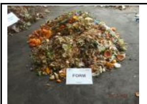
4.3 FORM no inclosa als grups 4.1 i 4.2