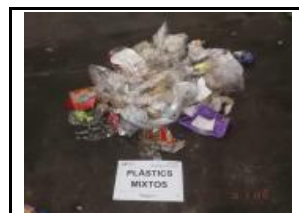
10. Plàstic, mixtos i film