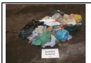
11. Bosses de plàstic