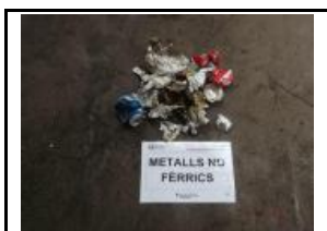
13. Metall no fèrric