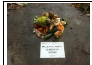
4.1 Malbaratament alimentari FORM