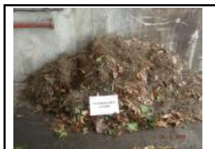
4.2 Fracció vegetal assimilable a FORM