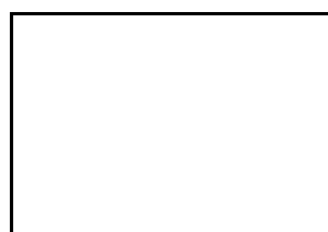
6. Poda voluminosa (trobadada a la mostra)