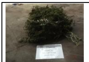
7. Poda no voluminosa (trobadada a la mostra)