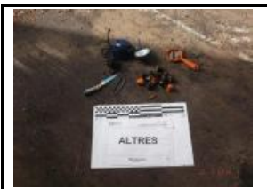
19.2 Altres no inclosos en grup 19.1