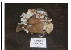
9. Paper i cartró